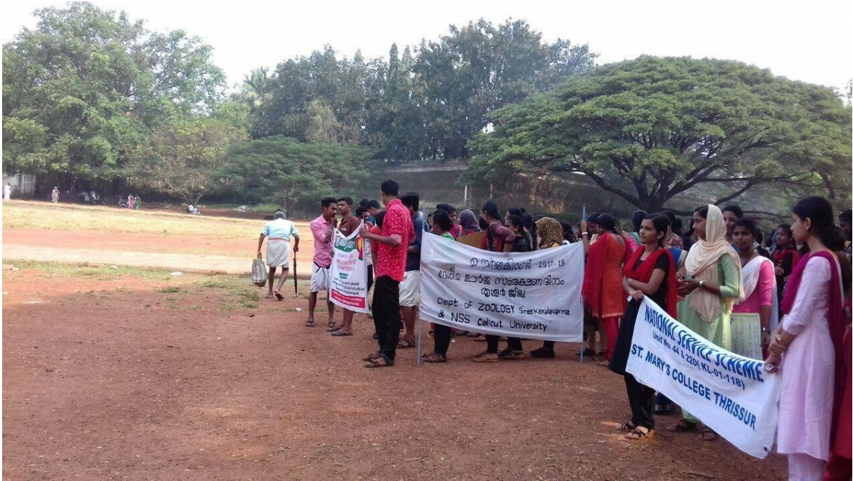
NSS STUDENTS IN RALLY