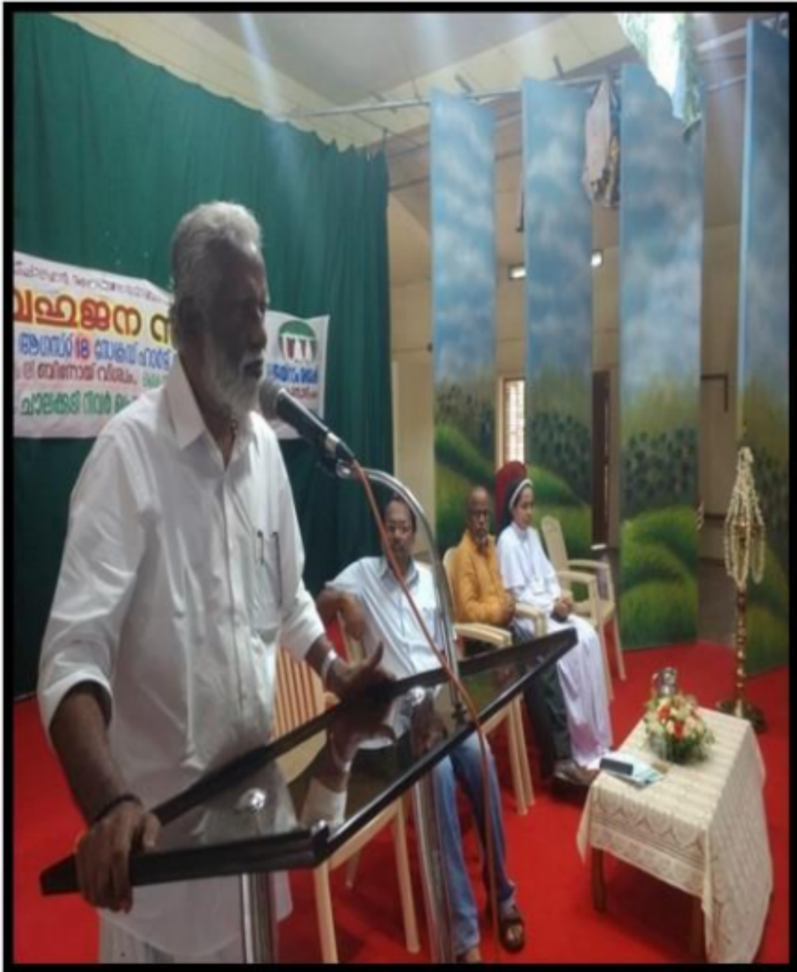
Former MP Sri. Binoy Viswam addresses the gathering