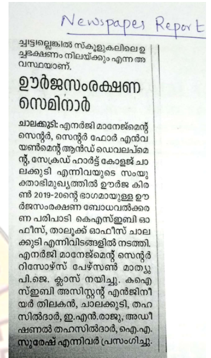
Newspaper Report on 14/02/2020