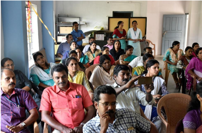
URJA KIRAN Energy Conservation Awareness Programme for employees of Taluk Office, Chalakudy on 13-02-2020